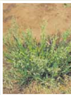
スズメノカタビラ