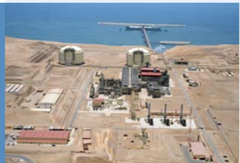
左图: 酸性气体的化学吸收 右图: OASE - 广泛、可靠的应用于天然气领域